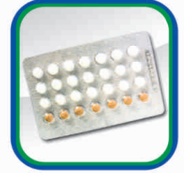
خواتین کے استعمال کیلئے مانع حمل گولیاں: