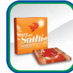
کنڈوم (مردوں کے استعمال کیلئے):