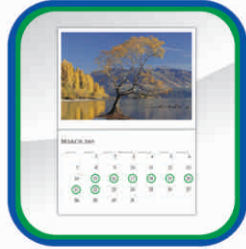
موزوں دنوں پر پبلی طریقہ: