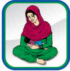
ماں کے دودھ پلانے کے ذریعے حمل روکنے کا قدرتی طریقہ، لیم (LAM):