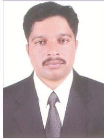
غلام دستگیر بائیوگیس ٹیکنیشن