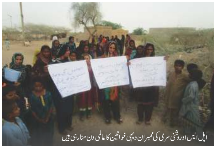
ایل ایس اور روشنی سری کی ممبران دیہی خواتین کا عالمی دن منا رہی ہیں

دیہی خواتین زرعی پیداوار، تحفظ خوراک اور غذائیت، زمین اور دیگر قدرتی وسائل کے انتظام اور تحفظ ماحولیات میں اہم کردار ادا کرتی ہیں۔ ہر سال 15 اکتوبر کو عالمی سطح پر دیہی خواتین کے عالمی دن کے طور پر منایا جاتا ہے۔ اس دن کو منانے کا مقصد عالمی سطح پر تمام اقوام کو یہ احساس دلانا ہے کہ وہ یہ تسلیم کریں کہ خواتین اور لڑکیاں دیہی گھرانوں اور دیہی کمیونٹی کی پائیداری، دیہات کی سطح پر مسائل پیداوار کے فروغ اور اجتماعی فلاح و بہبود کے لیے کیا کچھ کرتی ہیں۔ SUCCESS کے اسٹاف کے مشورے پر LSO روشنی سری نے 16 اکتوبر 2018ء کو پہلی دفعہ اپنی یونین کونسل کی سطح پر ایک ریلی کا انعقاد کیا۔ SUCCESS کے اسٹاف کے ساتھ بڑی تعداد میں خواتین اور بچوں نے اس ریلی میں شرکت کی۔ SUCCESS پروگرام کی خاتون سوشل آرگنائزر نے دیہی خواتین رہنماؤں اور ممبران کے جوش و جذبے کو سراہا اور انہوں نے اس قسم کی تقریبات منانے کے فائدے کو لوگوں کو بتائے۔ انہوں نے بتایا کہ اس قسم کی تقریبات کے انعقاد سے ان میں اتحاد و اتفاق اور خود اعتمادی میں بے تحاشا اضافہ ہوتا ہے۔