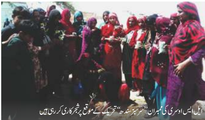
ایل ایس او سری کی ممبران ”سر سبز سندھ“ تحریک کے موقع پر شجرکاری کر رہی ہیں

صوبائی حکومت کی درخواست پر LSO روشنی سری نے بھی اس تحریک میں بھرپور حصہ لیا۔ مارچ 2018ء میں LSO نے شجرکاری کے بارے میں آگاہی پھیلائے کیلئے ایک ریلی نکالی، جس میں زندگی کے مختلف شعبوں سے تعلق رکھنے والے افراد نے حصہ لیا۔ ریلی کے شرکاء ایسے پوسٹر ہاتھوں میں اٹھائے ہوئے تھے جن پر شجرکاری کی اہمیت پر پیغامات درج تھے۔ مقررین نے ریلی سے خطاب کرتے ہوئے شجرکاری کی